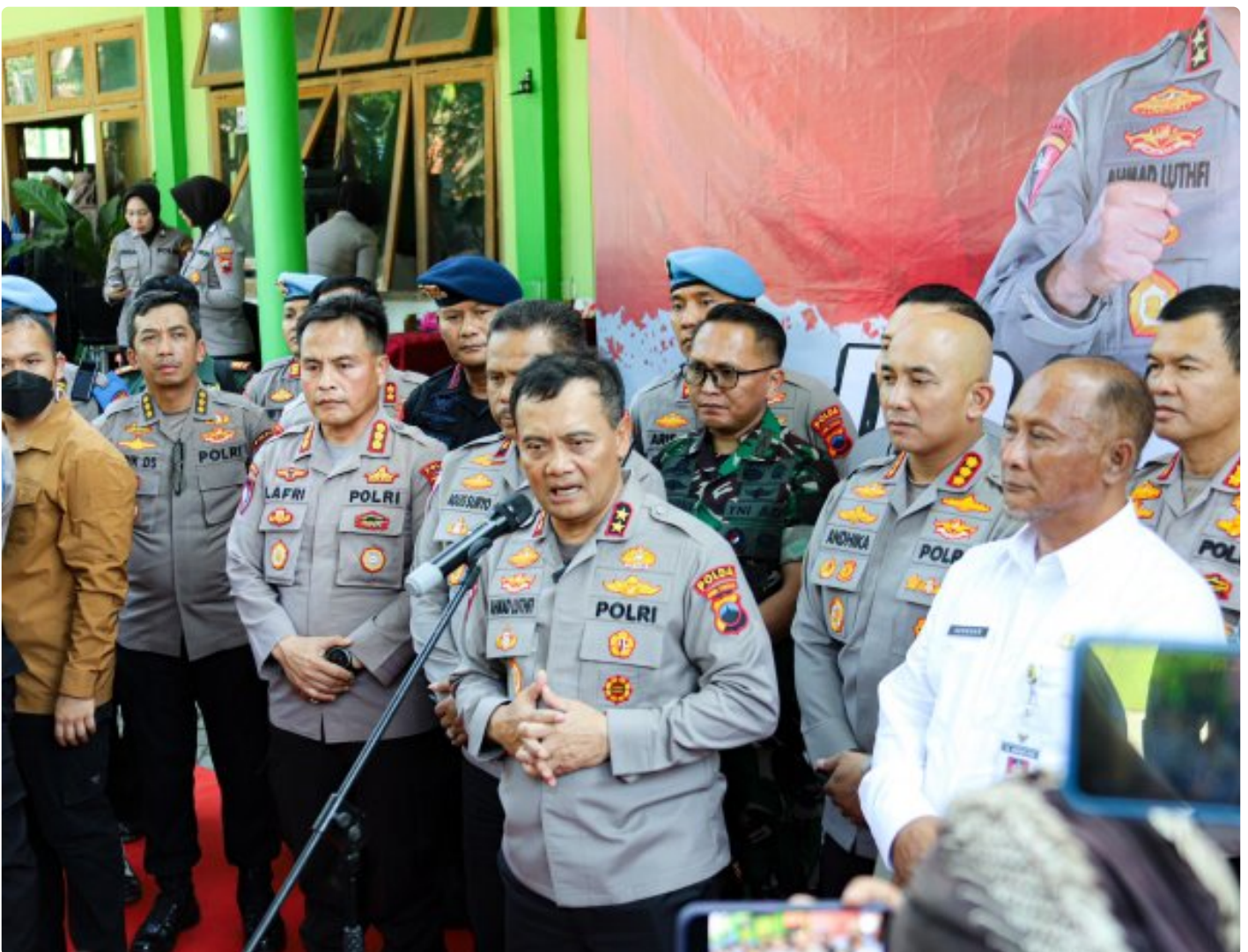
Foto: Kapolda Jateng Irjen Pol Ahmad Luthfi Mengimbau Warganet Untuk Menghentikan Pemberian Label Negatif di Wilayah Kabupaten Pati, Sabtu ( 22/6/2024).

KOTA SEMARANG- Penandaan negatif terhadap wilayah Sukolilo di Peta Digital kini telah berangsur hilang. Perubahan itu terjadi pasca kunjungan Kapolda Jawa